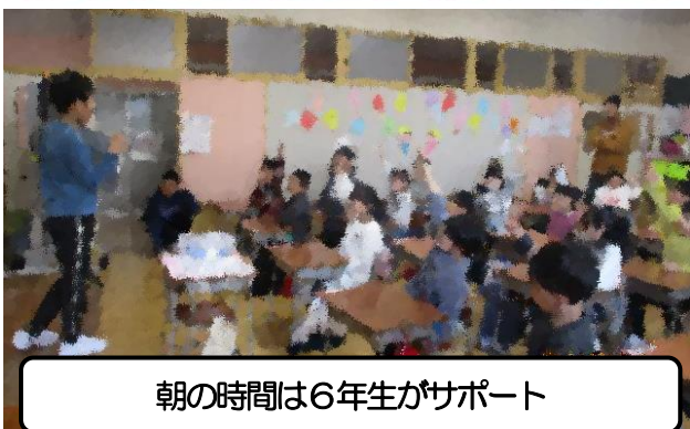
朝の時間は6年生がサポート