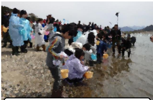
鮭の稚魚放流「元気に戻っておいで！」(5年)