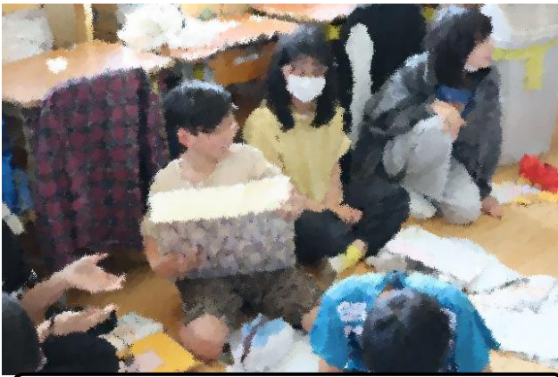
租税教室「1億円(ダミー)の重さは…」(6年)