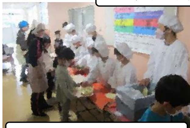
給食準備も上手になりました