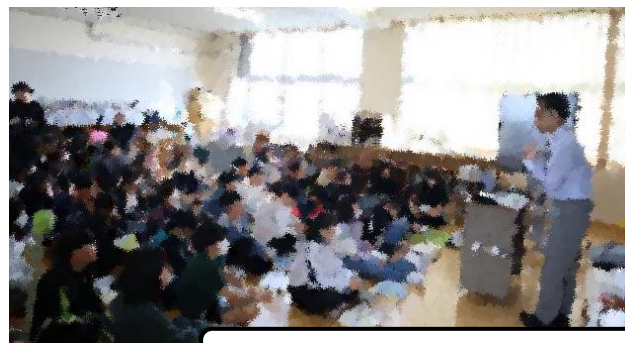
中央図書館の方々の協力をいただき、全学年で図書館指導を実施