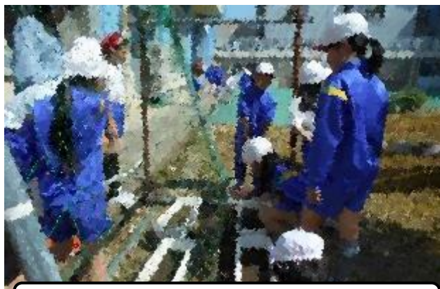
植えたヘチマはどこまで大きく？(4年)