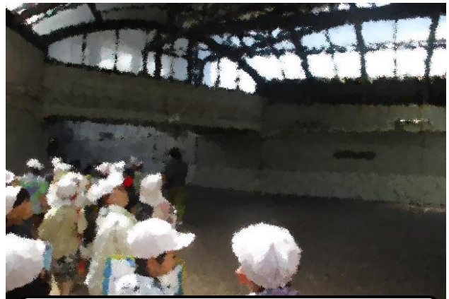
社会科 校外で「リアル」な学び(3年)