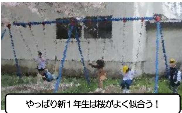
やっぱり新1年生は桜がよく似合う！