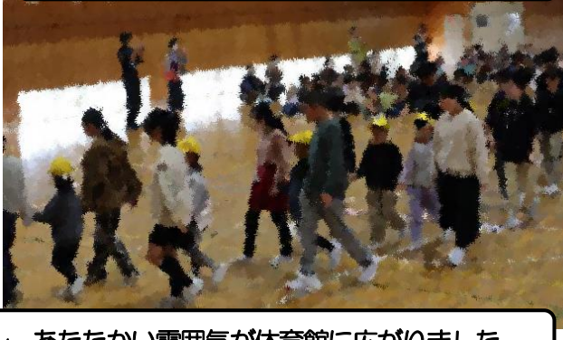
～1年生を迎える会～ あたたかい雰囲気体育館に広がりました