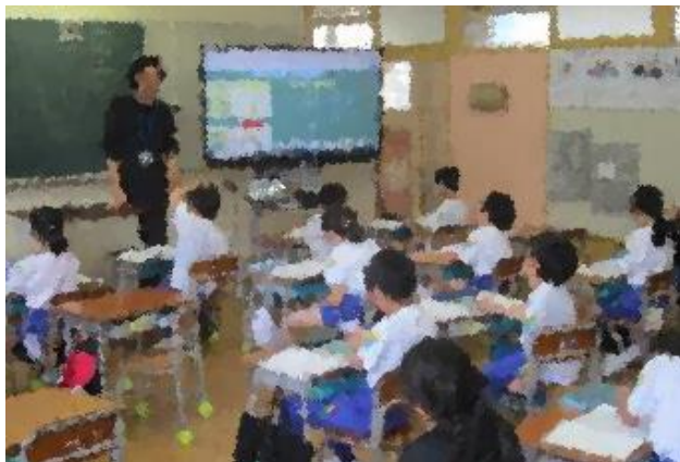
電子黒板での授業が日常に(2年)