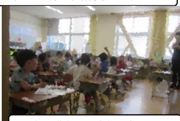
学習に集中しています ～生活科～