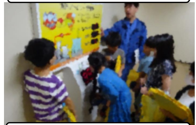
エコパークでゴミ処理の実際を学ぶ（4年）