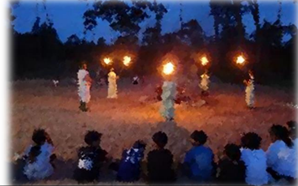
自然とともに 仲間とともに 充実した時間を過ごすことができました