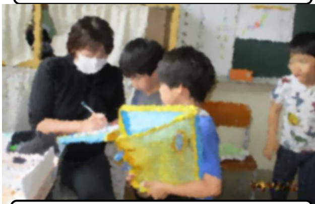
なかよしの輪を広げるサイン集め（1年）