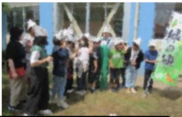
環境保全「にいがた緑の陣」への協力 ～お笑い芸人さんとゴーヤ植樹～（生活委員会）