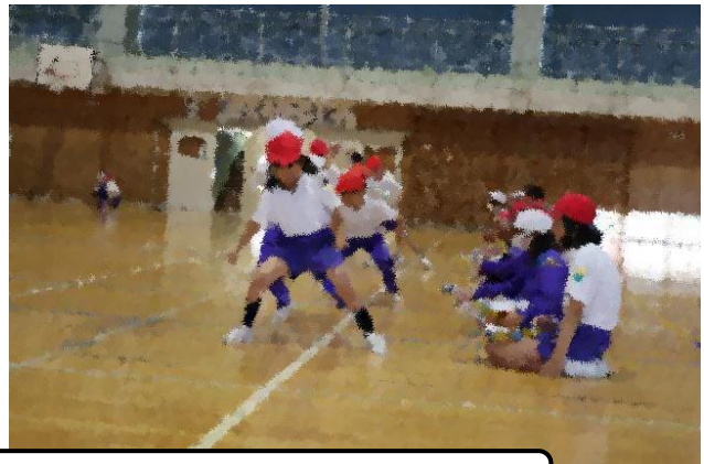
体カテストで様々な種目に挑戦（1年生の計測は高学年がサポート）