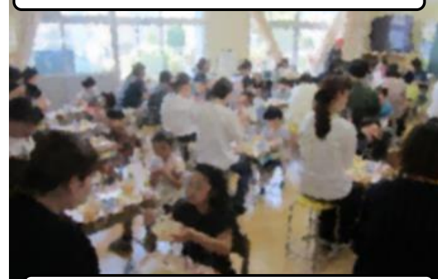
笑顔広がる親子給食試食会（2年）