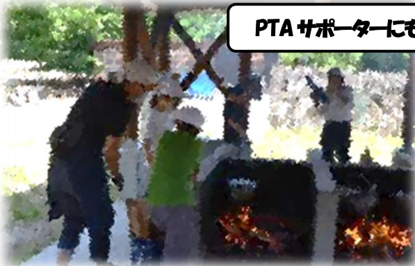
PTA サポーターにもご協力いただきました！