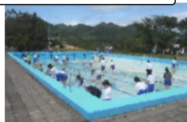
プール清掃に全力投球（6年）