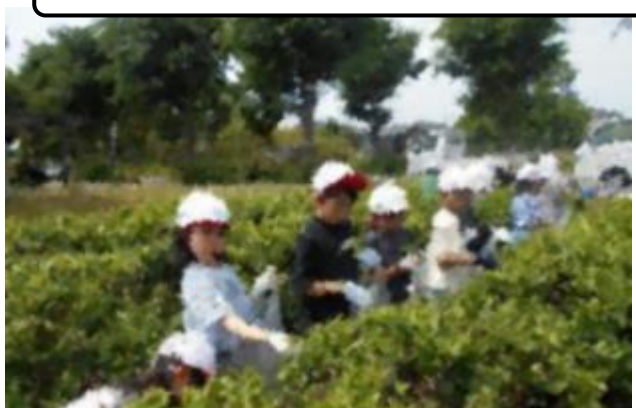
ふるさと村上を学ぶ茶摘み体験（3年）