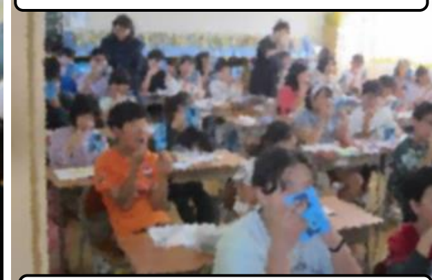
虫歯予防の意識をアップ（5年）